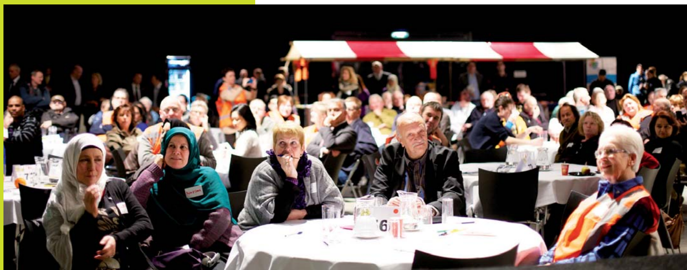
Burgertop Duizend op Zuid, januari 2013.

De voortgangsrapportage is opgesteld door het programmabureau NPRZ in opdracht van het dagelijks bestuur van het Nationaal Programma Rotterdam Zuid: