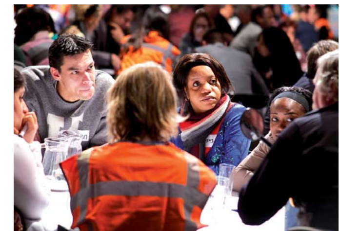
Bewoners in gesprek tijdens de Burgertop

Veel woningen in particulier bezit maken onderdeel uit van een Vereniging van Eigenaren (VVE). Alleen de VVE is vaak in staat noodzakelijk onderhoud aan de woningen te plegen. Probleem is dat veel van zulke VVE's een slapend bestaan leiden. Met behulp met VVE010, een samenwerkingsverband van de gemeente en woningcorporaties, is het de afgelopen tijd gelukt een flink aantal van deze verenigingen nieuw leven in te blazen.