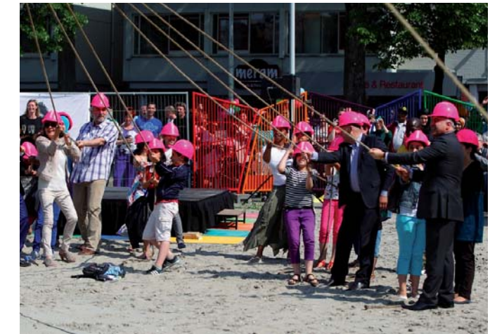
Eerste paal Bloemfontein

Om de beoogde investeringen in de woningen op Zuid voor elkaar te krijgen is de komende twintig jaar jaarlijks € 60 miljoen extra nodig. Het gaat dan om zowel sloop/nieuwbouw als het uitvoeren van (groot) onderhoud. Een deel van dit bedrag, waarschijnlijk € 22,5 miljoen, moet komen uit de 'verhuurdersheffing', uit het woonakkoord. Afgesproken is dat een deel van de opbrengst van de verhuurdersheffing ten goede komt aan investeringen in de woningvoorraad die een nationaal belang dienen, waaronder die van het Nationaal Programma Rotterdam Zuid.