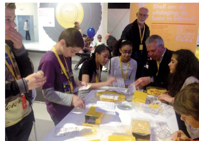
Shell Eco Marathon 2013

Meer mensen aan een zinvolle dagbesteding helpen is een belangrijke doelstelling van het NPRZ. Het NPRZ richt zich op jongeren met een diploma en op mensen met een uitkering. Het uitgangspunt is dat iedereen iets moet doen voor zijn geld.