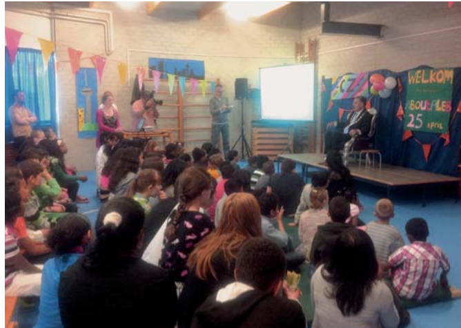
Opening children's zone op basisschool Groen van Prinsteren

Goed onderwijs is een van de belangrijkste voorwaarden voor de verbetering van Rotterdam Zuid. Het thema school valt in twee delen uiteen: aan de ene kant het tot stand brengen van Children's Zones rond de scholen, te beginnen in de focuswijken. Speciale zones rondom de scholen, waar alles is gericht op goede omstandigheden zowel op school als thuis, zodat kinderen beter kunnen leren op school. Aan de andere kant is het nodig jongeren te stimuleren een zo hoog mogelijke opleiding te volgen met goede kans op werk. Dat zijn vooral opleidingen in zorg en techniek.