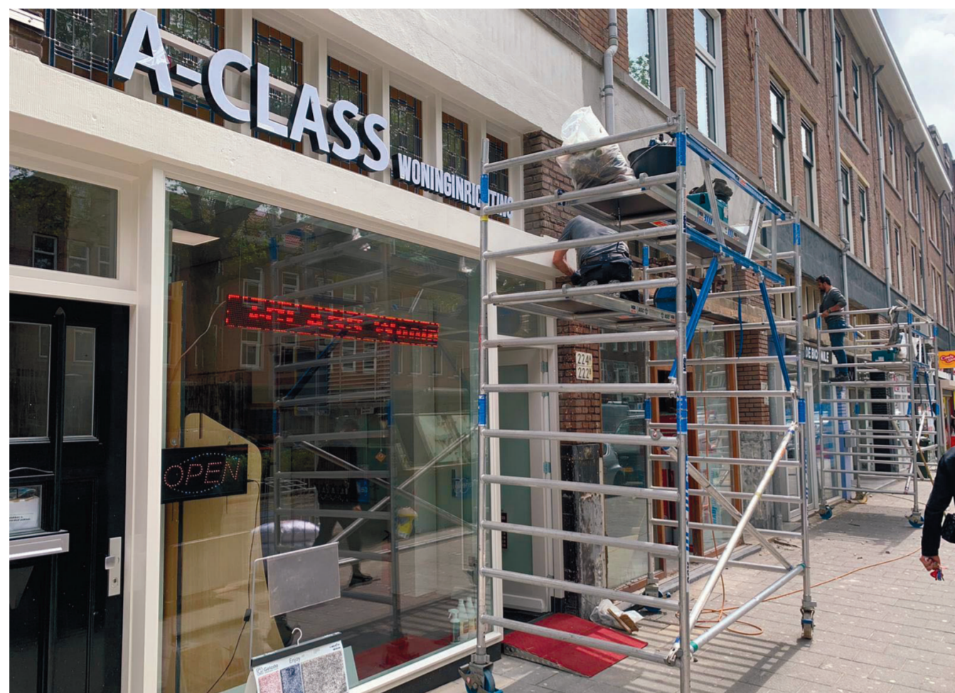
De Alliantie Hand in Hand is voortvarend aan de slag met het verbeteren van de winkelstraat Beijerlandse laan/Groene Hilledijk

Kwetsbare bewoners Vanaf de zomer is er veel meer aandacht gekomen voor de wijk Carnisse. Onder andere daar wordt stevig ingezet op de aanpak van malafide verhuurmakelaars en zorgaanbieders die misbruik maken van de kwetsbare positie van de bewoners in de wijk. Ook zijn er weerbaarheids-trainingen aangeboden aan scholieren tegen mensenhandel en worden pandeigenaren voorgelicht over de risico's die onlosmakelijk verbonden zijn met de verhuur van vastgoed. Malafide ondernemers, pandeigenaren en personen worden aangepakt, maar kwetsbare personen en branches worden beschermd en weerbaar gemaakt. De LVB-pilot (licht verstandelijke beperking) in de Tarwewijk, waarin zowel bij preventie als bij repressie gezamenlijk extra aandacht wordt gegeven aan personen waarvan vermoed wordt dat zij een licht verstandelijke beperking hebben, is in de loop van het jaar uitgebreid. Ook jongeren kunnen nu instromen in het project. Het geografische gebied waaruit zaken kunnen