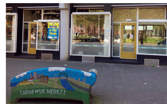
Kantoor programmabureau NPRZ.

werken voor het bestuur van het NPRZ. Voor zover niet elders gepositioneerd, zijn zij rechtspositioneel aangesteld bij de gemeente. De directeur NPRZ legt verantwoording af aan het bestuur van het NPRZ. De directeur heeft rechtstreeks toegang tot de leden van het bestuur NPRZ, is verantwoordelijk voor de integrale uitvoering van het NPRZ en spreekt partijen op hun verantwoordelijkheid aan. De directeur zorgt voor een adequate monitoring van het programma en agendeert knelpunten bij het bestuur. De directeur draagt zorg voor het draagvlak bij de partners, ook in de contacten met de relevante departementen, toezichthouders en volksvertegenwoordigingen, en media. In deel II is een verantwoording over de financiën van het programmabureau opgenomen. In 2020 is € 928.879 besteed, dit valt binnen het budget van € 1.040.000.